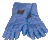
Guantes criogénicos (Consultar códigos e información técnica)